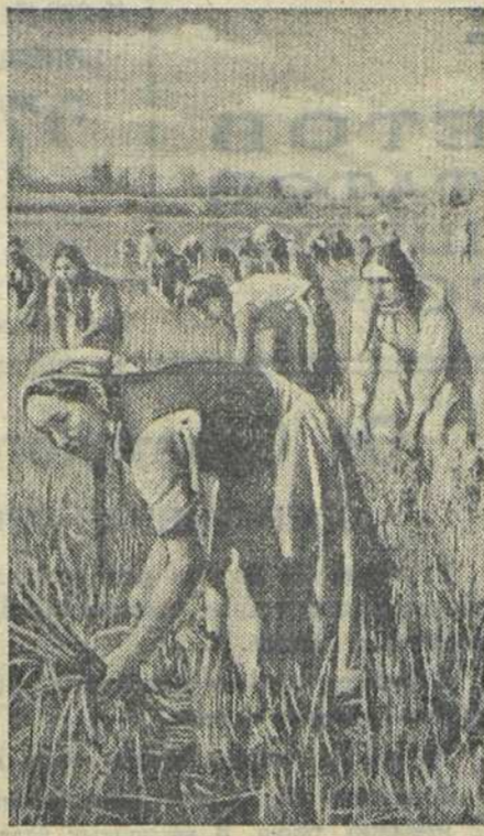
В колхозе «Красный Восток» (Ивановский район, Калининская обл.) идет большой урожайный рас. На полях идет последняя прополка.